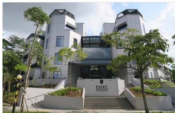
Campus Asie-Pacifique de l'ESSEC à Singapour, Népal Hill

La pédagogie reposant sur les apports théoriques, les exemples réels et des cas pratiques, s'appuie aussi sur la participation et l'expérience des participants, avec de nombreux travaux de groupes.